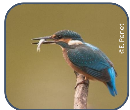
Martin-pêcheur d'Europe ( Alcedo atthis )