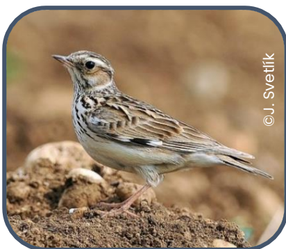
Alouette lulu ( Lullula arborea )

Parmi elles, trois espèces prioritaires au titre de Natura 2000 ont été observées : l' Alouette lulu , le Martin-pêcheur d'Europe et le Pic mar (photos ci-dessous).