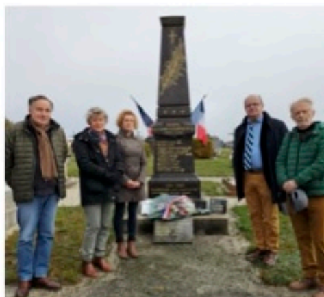
Commémoration du 11 novembre