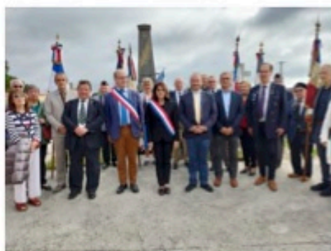
Commémoration du 9 août