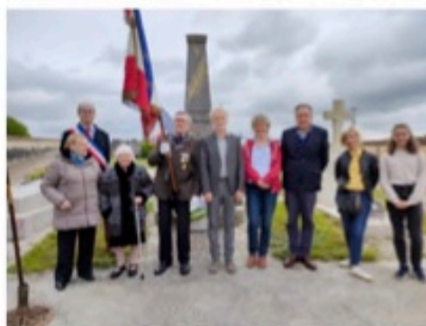
Commémoration du 8 mai