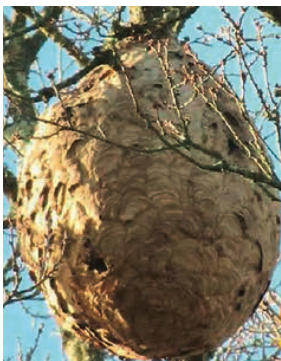
Nid de frelons asiatiques